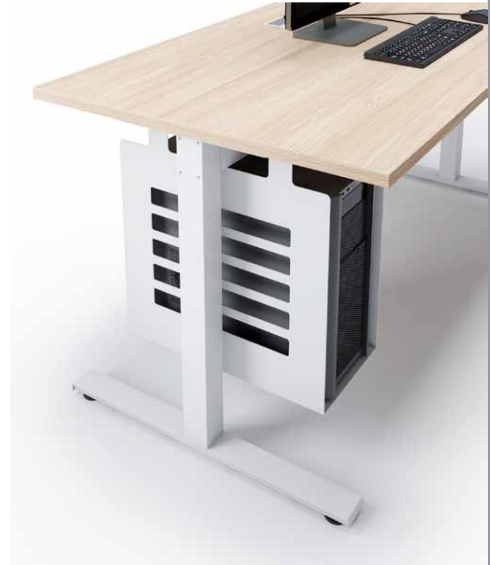
Porta computer in metallo. Metal CPU holder.