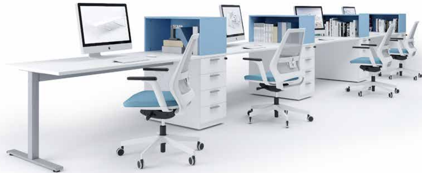
Scrivania con modesty panel. Desk with modesty panel.